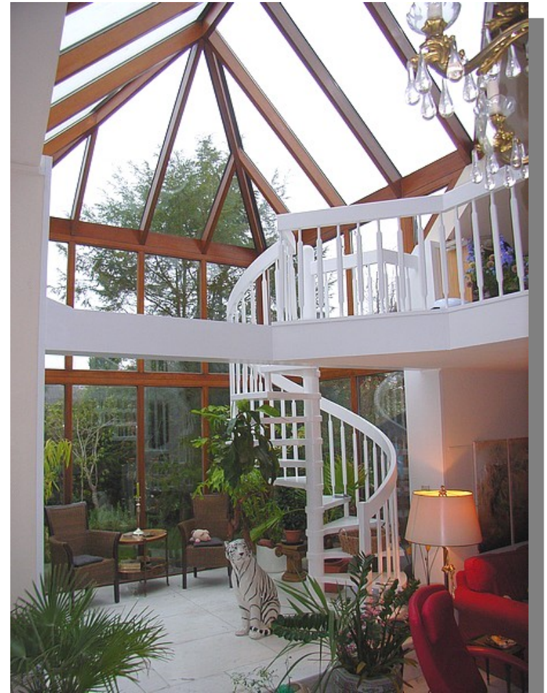
Wintergarten mit Galerie